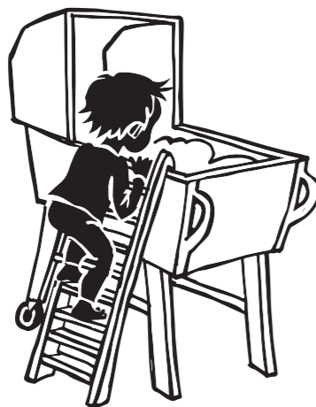
Kravle op Barnet kravler selv op i krybben Fyld fx krybben med små bolde som børnene kravler op og henter - og kaster