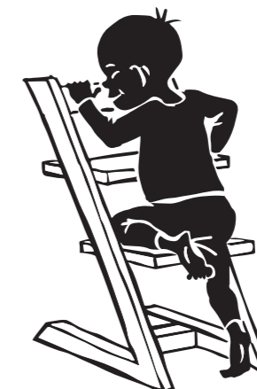
Kravle op Barnet kravler selv op på stolen

Ved at sætte fokus på processen, barnets aktive rolle og give barnet tid til at øve de forskellige færdigheder, gives barnet et bedre grundlag for videre bevægelsesudvikling.