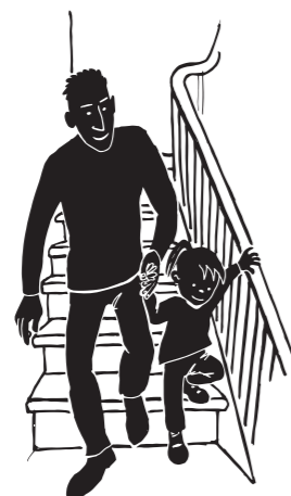
Gå på trapper Barnet går op og ned af trapper med støtte fra en voksen

Giv barnet god tid til at forsøge selv, før du hjælper.