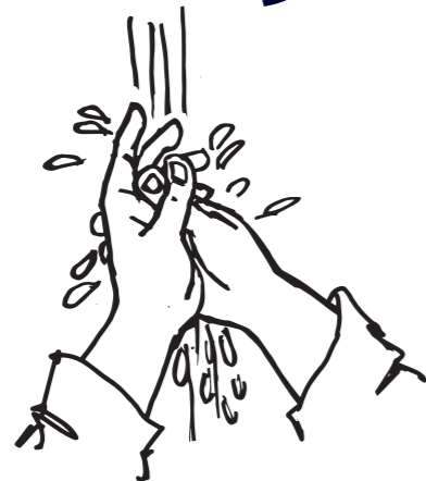
Vaske hænder Barnet vasker selv hænder