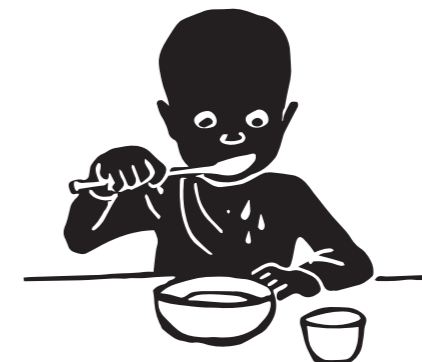
Spise og drikke Barnet spiser selv med ske og drikker selv af kop