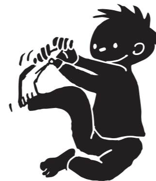
Af/påklædning Barnet øver sig i at tage sko og strømper af