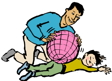
Boldmassage med større bold / pilates-bold