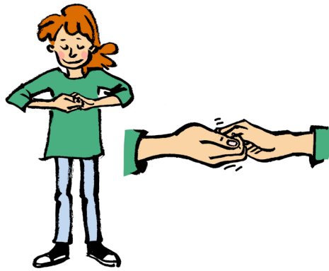
Fingertræk og håndfladeskub