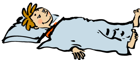
Ligge under tæppe