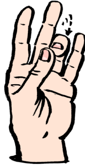
Hver finger til tommel