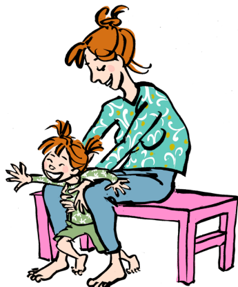
Mase sig fri fra en voksens ben