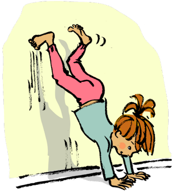
Stå på hænder