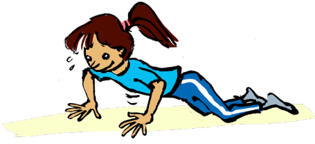
Push up på knæ