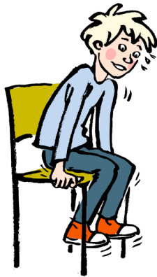
Gulv- eller stolearmbøjninger