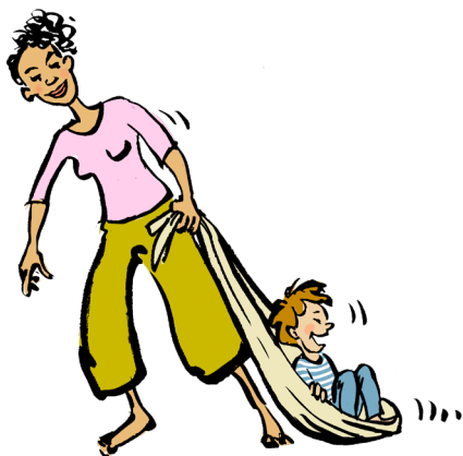
Hive på tæppe