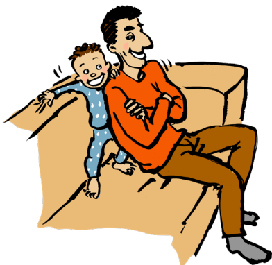
Mase sig forbi en voksen