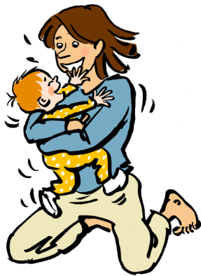
Være fanget af en voksen