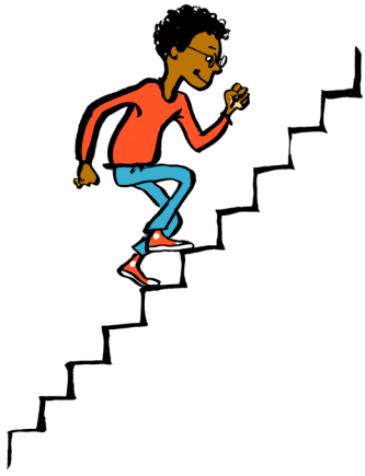
Gå på trapper