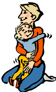
Klemme en voksen