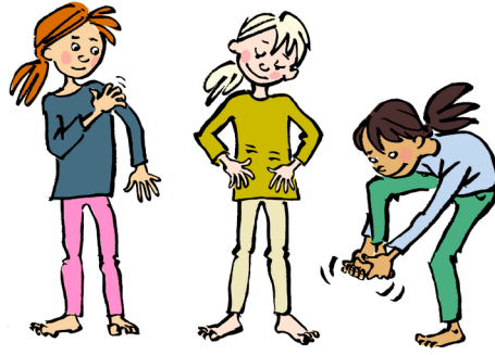
Helkropsmassage; tryk og klap din krop