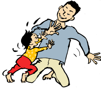
Skubbe en voksen