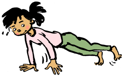
Planke i bevægelse