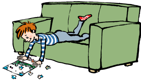
Planke på sofa